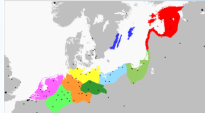
Zasięg Hanzy około roku 1400

Hanza, Liga Hanzeatycka – związek miast handlowych Europy Północnej z czasów średniowiecza i początku ery nowożytnej. Miasta należące do związku popierały się na polu ekonomicznym, utrudniając pracę kupcom z miast nienależących do związku, jednocześnie zaś stwarzały realną siłę polityczną i niekiedy wojskową.